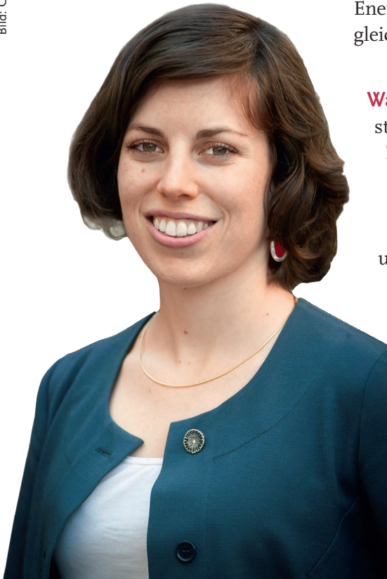
Lisa Mazzone, Vizepräsidentin der Grünen Schweiz und 2015 als jüngste Nationalrätin gewählt.

Was möchten Sie den Jugendlichen mitgeben? Ich wünsche mir, dass gerade auch Jugendliche aktiv werden für eine offene Gesellschaft. Es geht um eure Zukunft. Geht auf andere zu. Bleibt offen für andere Ideen und Kulturen.